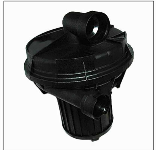
Pompa aria secondaria CODICE: 9600

Il calore sviluppato durante questo processo, riscalda ulteriormente la sonda lambda e la regolazione corretta della miscelazione viene realizzata in un periodo di tempo più breve.